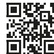
Таблица диаметров и масс кабелей, сертификаты, свидетельство РМРС доступны на веб-сайте: https://gerda.ru/gerda-ksd