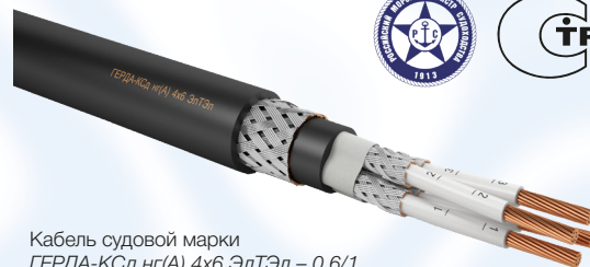
Кабель судовой марки ГЕРДА-КСд нГ(А) 4х6 ЭлТэл – 0,6/1