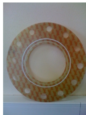
Уплотнение типа E

Уникальная запатентованная конструкция PGE включает диск и два уплотняющих элемента, установленные в концентрических канавках, выточенных со смещением друг относительно друга на обеих сторонах диска и частично перекрывающихся по глубине. Перекрывающиеся уплотняющие элементы устраняют потенциальную возможность просачивания/выпотевания рабочей среды между различными слоями материала несущего диска, что свойственно всем традиционным уплотнениям из слоистых стеклопластиков. Уплотняющим элементом может быть либо кольцо круглого сечения из эластомера или более сложное подпружиненное уплотнение из тефлона в форме «ласточки хвоста». Такая конструкция дала возможность, без больших затрат и дополнительного обслуживания, обеспечить одновременно надежное уплотнение, электрическую изоляцию и снижение коррозии поверхностей фланцев.